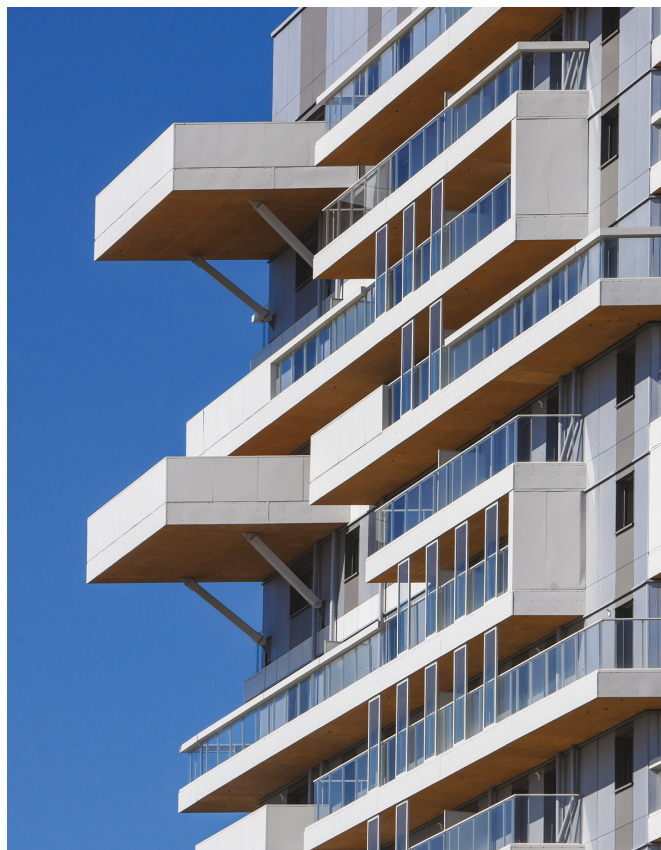
Hypérion © Atelier Philippe Caumes

Néanmoins, les projets urbains ne peuvent se limiter au seul paramètre carbone, aussi crucial soit-il. L'EPA revendique une approche équilibrée de l'acte de construire, au bénéfice de tous , donc en imposant d'autres paramètres destinés à continuer à maîtriser la programmation et les prix de sortie.