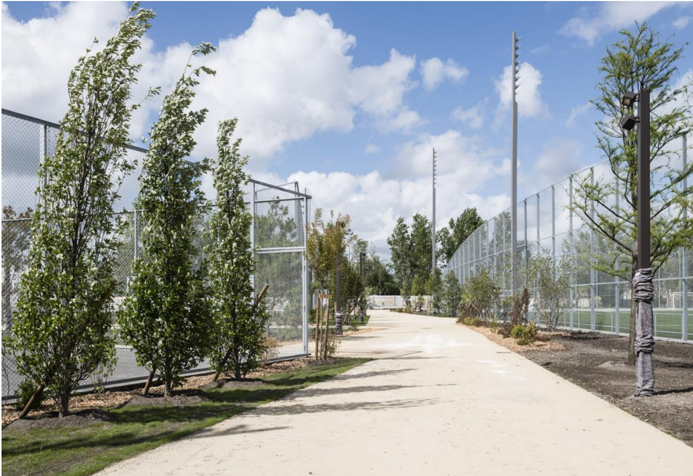
Le Jardin sportif Suzanne Lenglen.

Les travaux en cours quai Deschamps visent à élargir les trottoirs et créer un terre-plein central planté pour apaiser cet axe stratégique. Même logique pour le Boulevard Joliot Curie où le chantier a également démarré, l'EPA métamorphose ici cet axe autoroutier en voie de centre-ville.