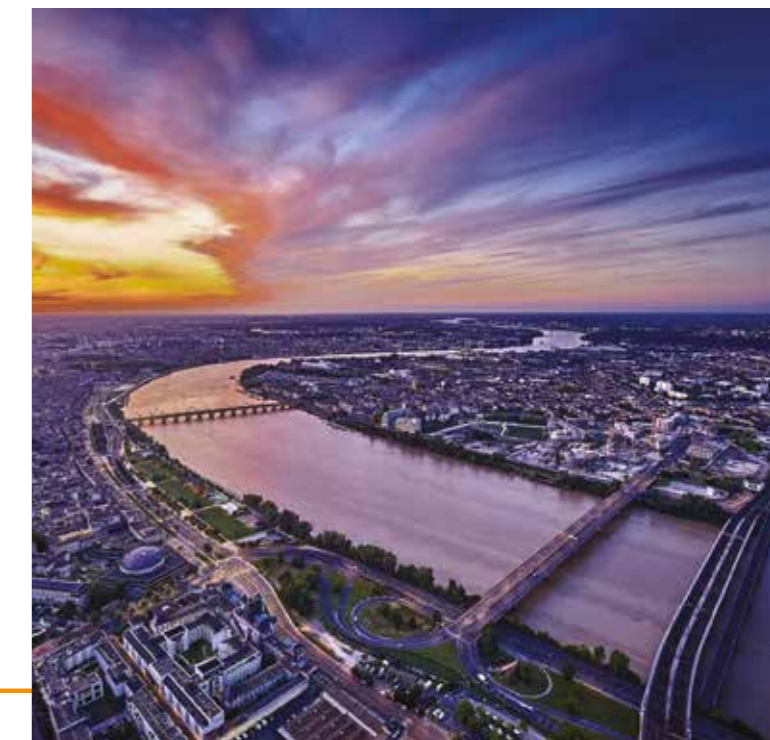
Vue aérienne de l'OIN

Alors que de nombreux chantiers sont en pleine activité, l'EPA Bordeaux Euratlantique associe le public à toutes les étapes de la fabrique de la ville.