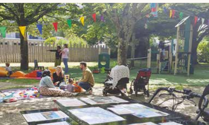
Médiation lors de l'évènement « Un quartier qui bouge » dans le parc Brascassat

La première enquête, menée entre décembre 2023 et janvier 2024, a ciblé la ZAC Bordeaux Saint-Jean Belcier. Trois questionnaires spécifiques - pour habitants, travailleurs et visiteurs - ont été diffusés via web, réseaux sociaux et terrain, dépassant l'objectif de 600 répondants avec près de 1 300 questionnaires complétés. La seconde enquête, réalisée au second trimestre 2025 sur le secteur Deschamps-Belvédère, poursuit cette démarche d'évaluation des usages et d'amélioration des espaces urbains, en lien avec les besoins réels des habitants et usagers. Les résultats sont attendus au printemps 2026.