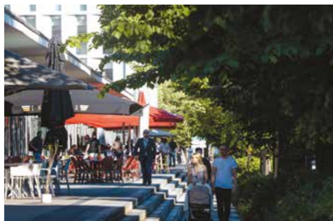
Halle Boca - Paludate-Corto Maltese

Commercialisation : Crédit Agricole Immobilier