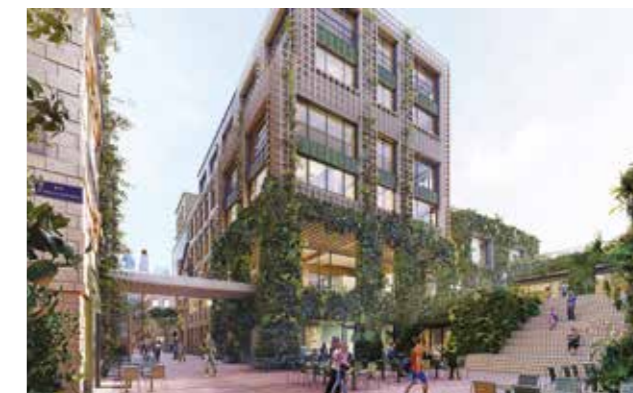
Perspective Canopia Saget-Descas © Maison Edouard François © Doug&Wolf