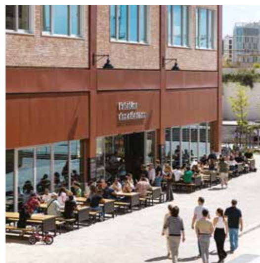
Amédée Saint-Germain