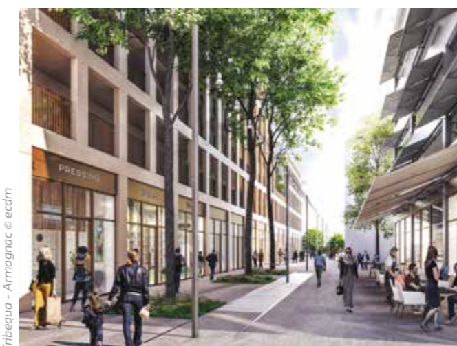
Tribéqua - Armagnac © ecdm