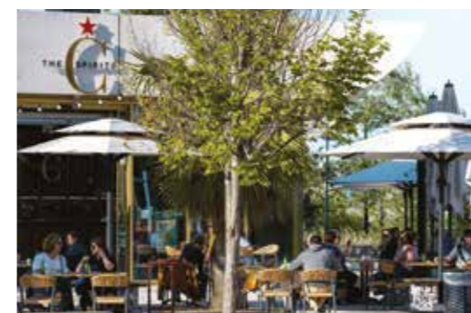
Paludate-Corto Maltese