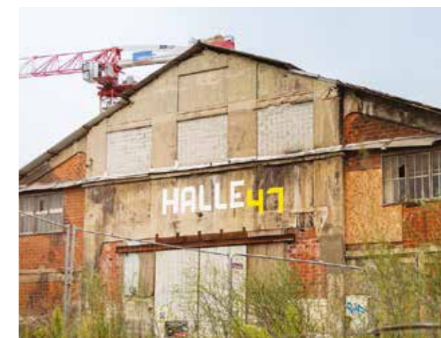
Halle 47 - Souys Eiffel