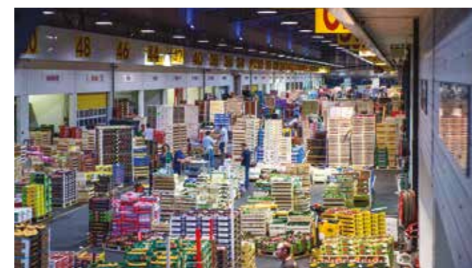
Marché d'Intérêt National