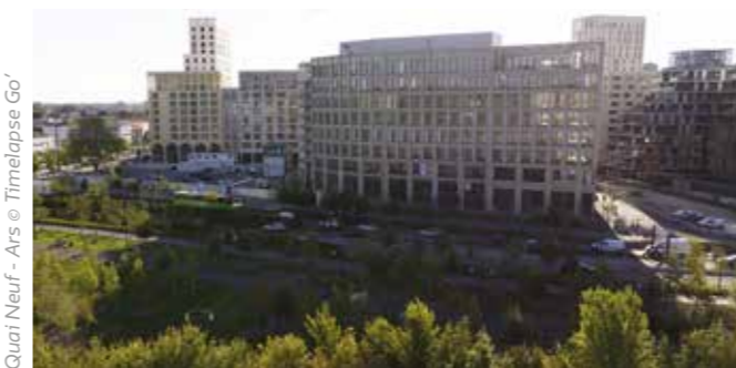
Quai Neuf - Ars