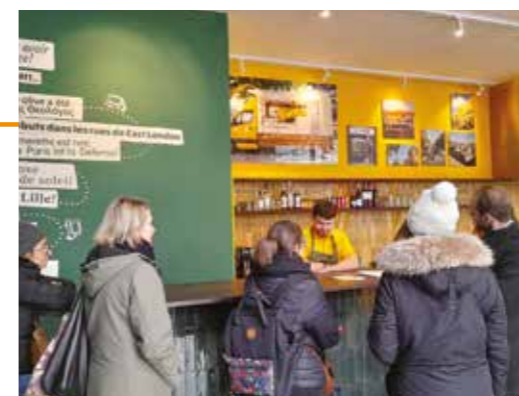
Kalimera - Deschamps-Belvèdère