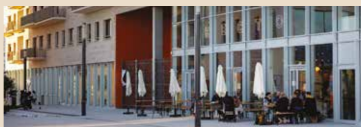
Place Marie de Gournay - quartier Deschamps-Belvédère

Balcon sur la ville de pierre, le quartier Deschamps-Belvédère compose un lieu de vie résolument mixte à l'extrémité du pont Saint-Jean. Une offre commerciale variée se constitue tout autour de la grande place Marie de Gournay. Complémentaire des commerces en pied d'immeuble, le pavillon culturel Bien public, géré par la Cultplace, fait de Deschamps-Belvédère une destination effervescente pour les habitants des deux rives. 82 % des commerces bénéficient d'un encadrement de leur loyer.