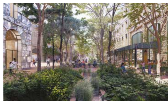
Perspective Canopia, Saget-Descas © Maison Edouard François © Doug&Wolf