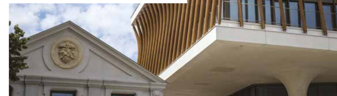
Millesima - Paludate-Corto Maltese

▷ Identifier et accompagner une offre productive renouvelée sur les secteurs en mutation :